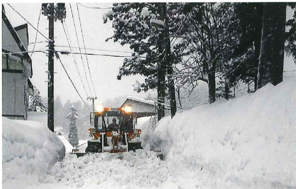
早朝からの除雪作業